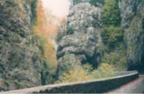
L'automne en Vercors

A pied, à vélo ou à cheval, au fond des grottes ou au sommet des falaises, sous une cascade ou au fil de l'eau,