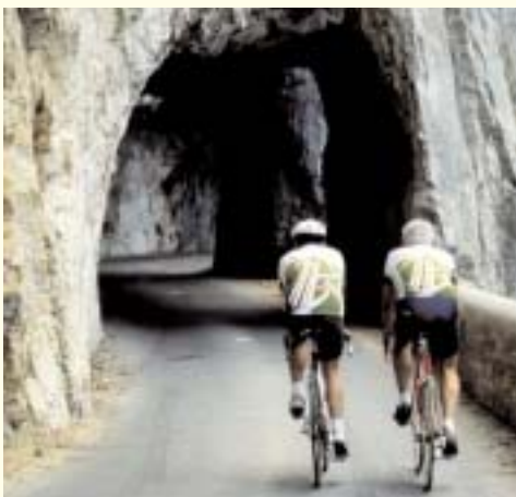
Les Gorges en vélo