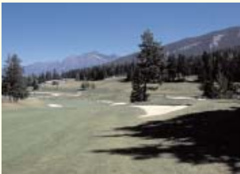
Parcours de golf magnifiques

Les cyclotouristes trouveront un réseau de routes calmes, de niveau très varié.