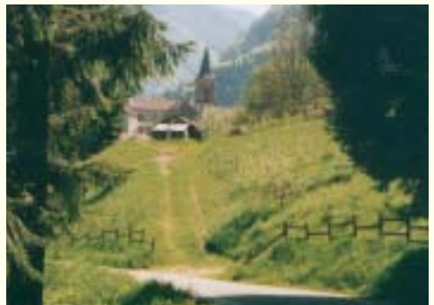
L'église de Rencurel

En hiver, vous pouvez apprécier les plaisirs de sport d'hiver.