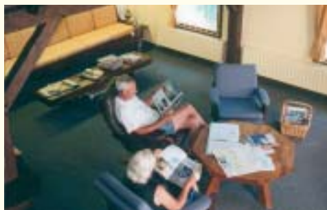
Le salon avec cheminée