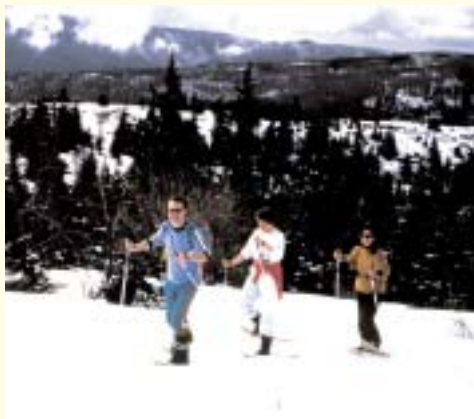
Raquettes dans les Coulmes