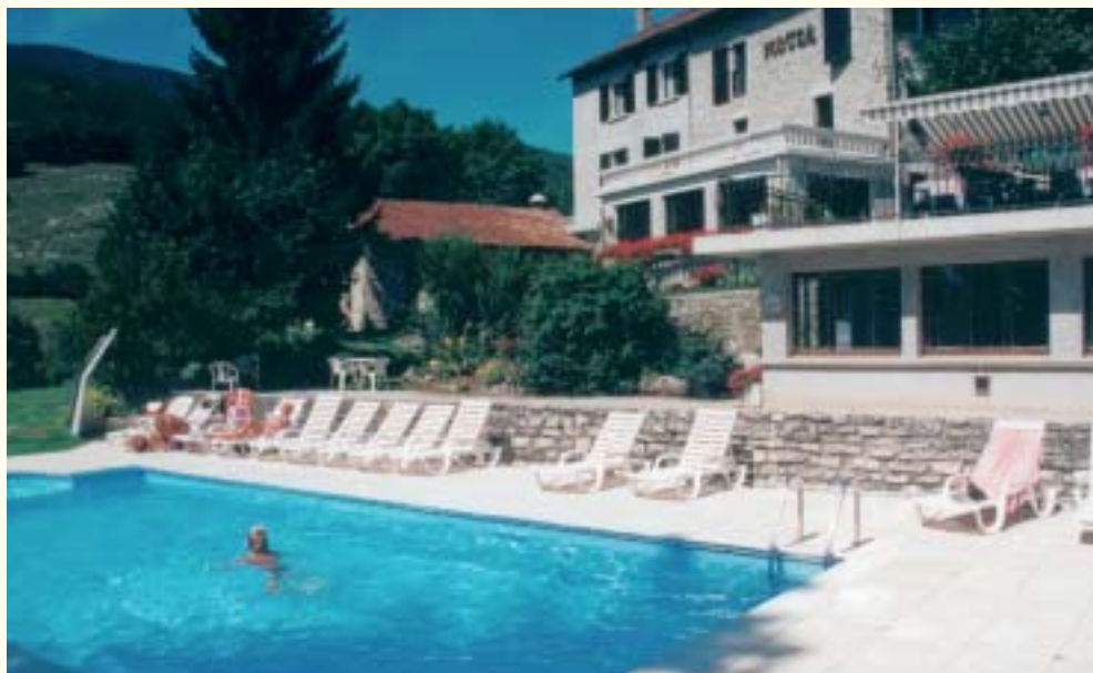
Se reposer à la piscine