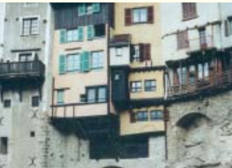
Villages historiques à proximité

le Vercors, c'est la nature à l'état brut. Les très nombreux sentiers de randonnée pédestre et itinéraires à vélo permettent d'en approcher la richesse, et des excursions en voiture vous permettent de découvrir les